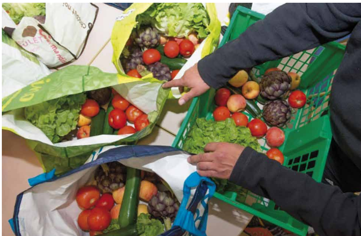
Distribution de paniers solidaires avec des produits locaux au sein d'une maison des habitants

alimentation locale de qualité, respectueuse de l'environnement et accessible à tous. Les axes de travail prioritaires sont la préservation et la transmission du foncier agricole et l'emploi en agriculture, ainsi que l'augmentation de la part des productions locales et de qualité dans les assiettes.