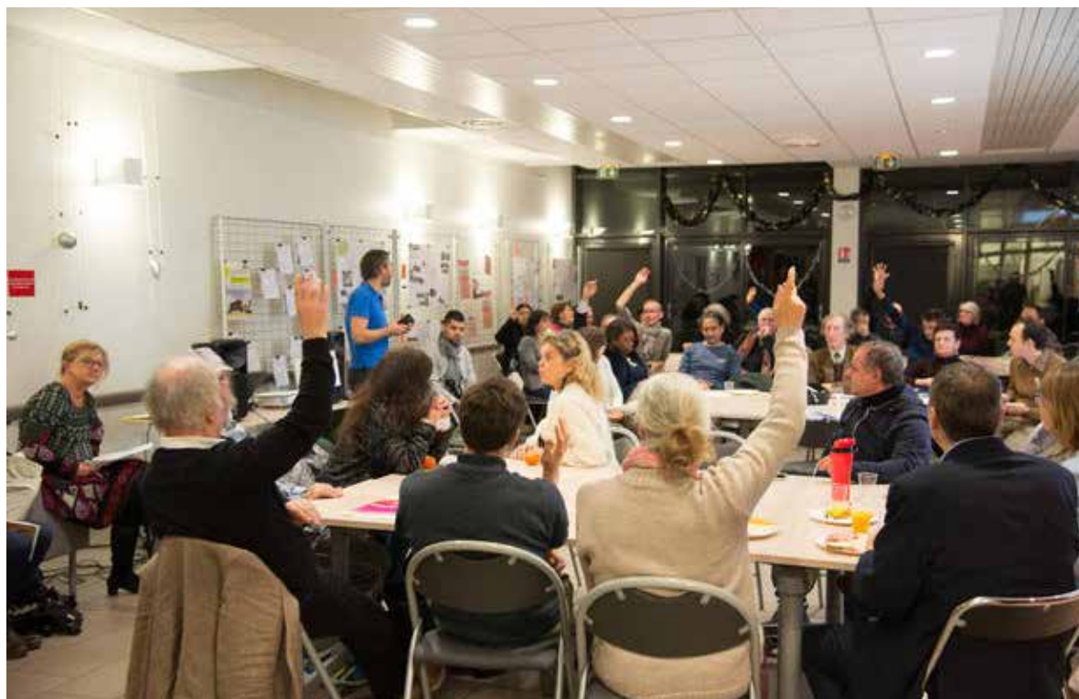
Session de travail et débat lors d'un atelier de projet

Après plusieurs sessions de travail débutées à l'automne 2018, les trois ateliers de projets ont chacun fait l'objet d'une délibération présentée en conseil municipal en 2019 afin d'établir des pistes d'actions sur les thématiques suivantes : améliorer la sécurité et la cohabitation des piétons et des cycles, favoriser la revitalisation des commerces et des services de proximité et lutter contre l'isolement des personnes âgées en situation de vulnérabilité.