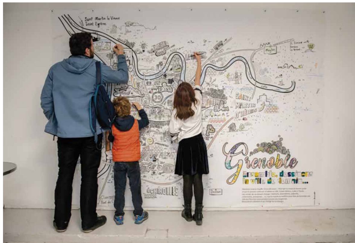
Participation du grand public aux événements de la Biennale des Villes en transition