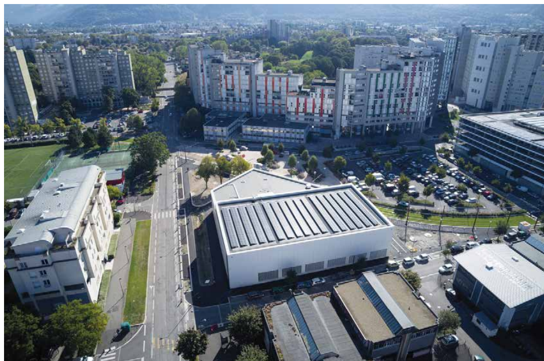
Installation de 600 m 2 de panneaux photovoltaïques sur le gymnase Jean-Philippe Motte inauguré en 2019

Dans un premier temps, la Ville a lancé une étude inédite sur la composition des fournitures les plus utilisées, puis des critères sanitaires ont été mis en œuvre dans le marché de fournitures et enfin les produits les plus sains ont été mis en évidence sur le site permettant aux enseignants de faire leur commande afin que le critère sanitaire puisse être pris en compte dans leurs choix. Un guide de sensibilisation pour les enseignants et les parents a également été mis à disposition. Bien qu'aucune réglementation en France ou en Europe n'existe en la matière, la Ville de Grenoble est la première en France à avoir engagé un tel travail et souhaite sensibiliser ses partenaires locaux et les villes du réseau des « villes santé » de l'OMS notamment.