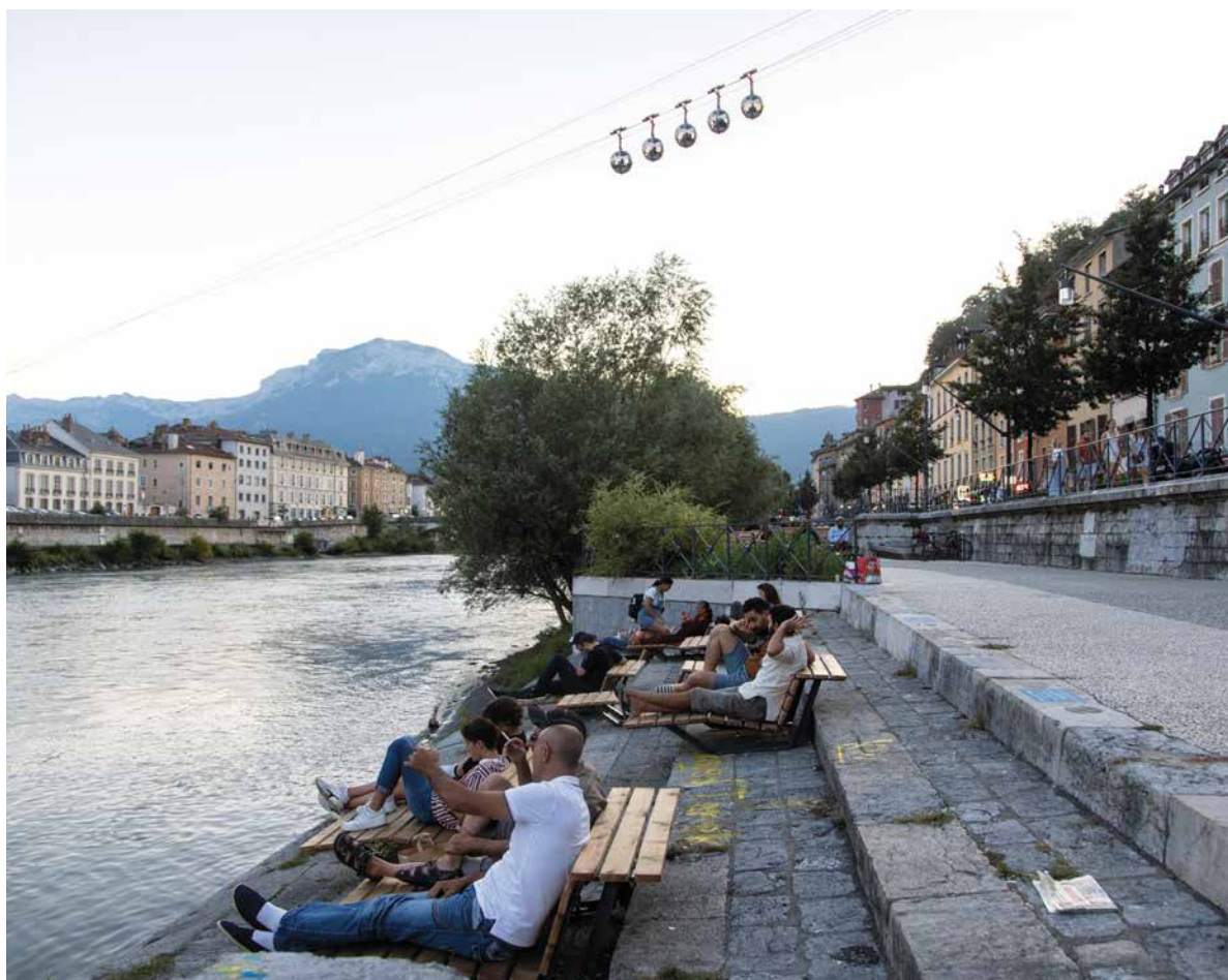
« Un pas vers l'eau » une réalisation du budget participatif pour rendre plus accessible les berges de l'Isère

Afin de réduire les nuisances et favoriser les nouvelles mobilités, les demandes de la Ville concernant l'abaissement de la vitesse à 70 km/h et l'expérimentation à partir de 2020 d'une voie réservée au covoiturage sur le tronçon entre Grenoble et Voreppe ont été intégrées par l'Etat et AREA.