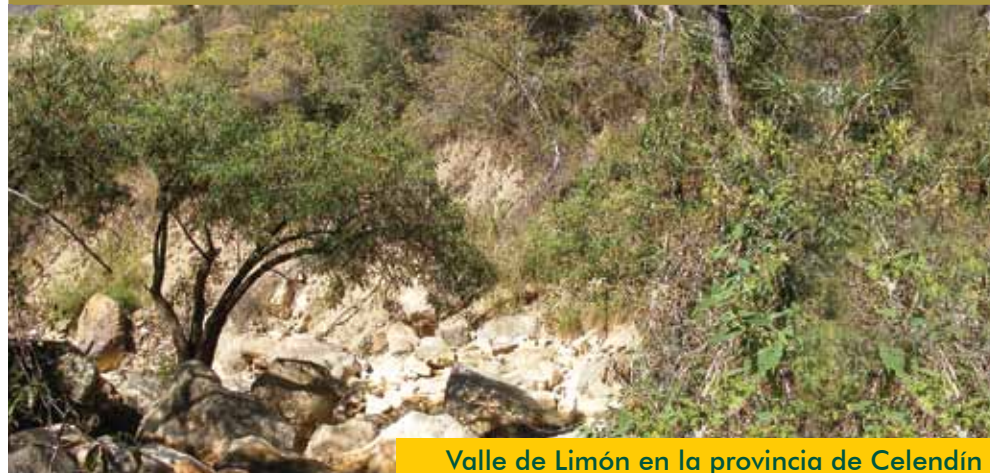
Valle de Limón en la provincia de Celendín

Bosques muy ralos con pocas especies, abundantes cactus y lluvias muy esporádicas.