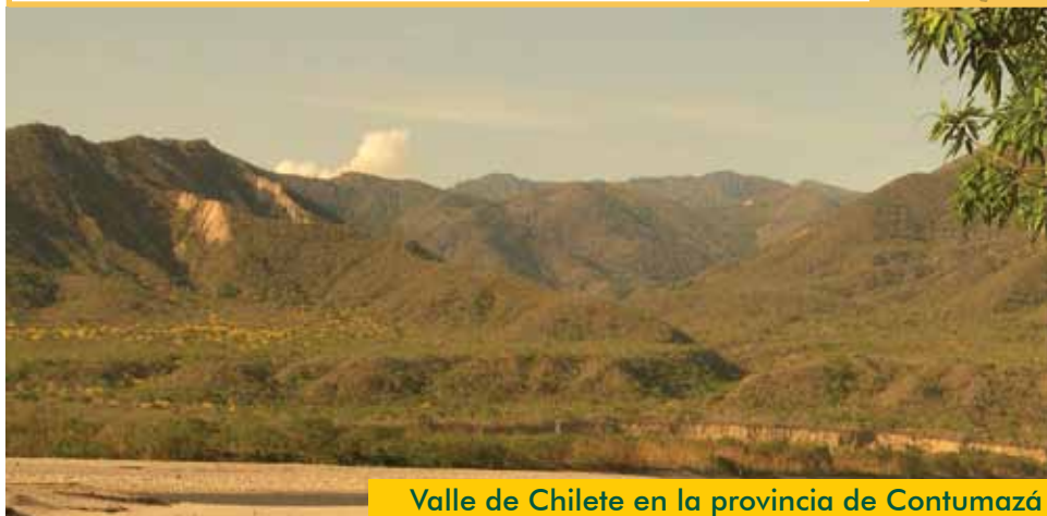
Valle de Chilote en la provincia de Contumazá

Bosques con escasa vegetación que bajan hacia la costa. Incluyen algunos bosques húmedos en las partes más altas.