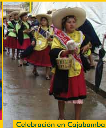
Celebración en Cajabamba