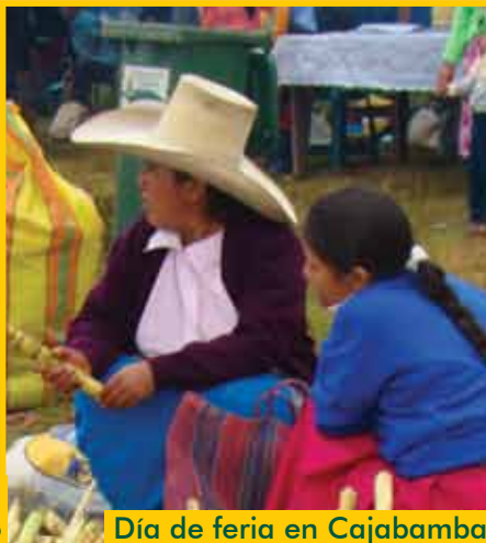
Día de feria en Cajabamba