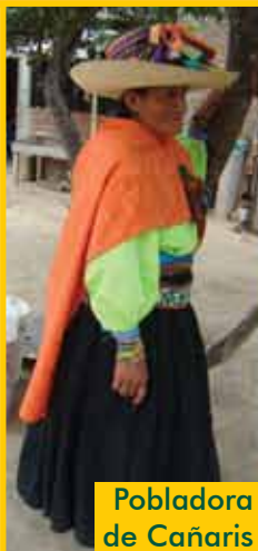
Pobladora de Cañaris