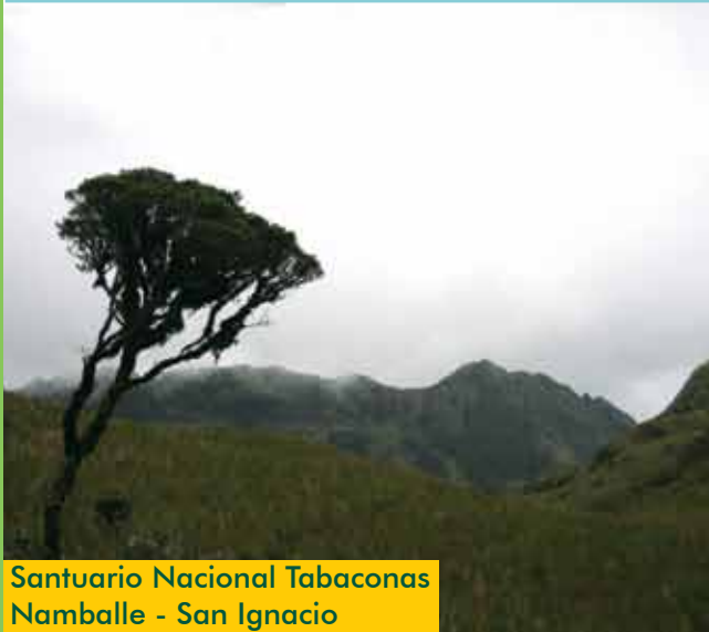
Santuario Nacional Tabaconas Namballe - San Ignacio