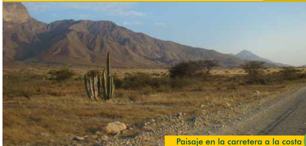
Paisaje en la carretera a la costa

Espacios áridos y con escasa vegetación en pequeñas áreas de San Miguel y Contumazá.