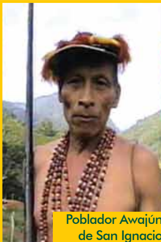
Poblador Awajún de San Ignacio