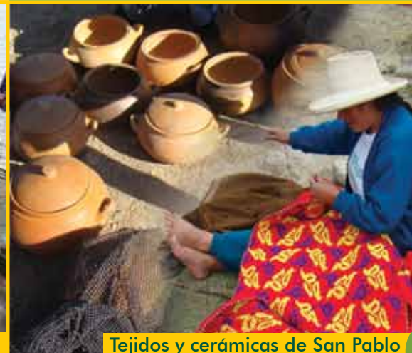
Tejidos y cerámicas de San Pablo