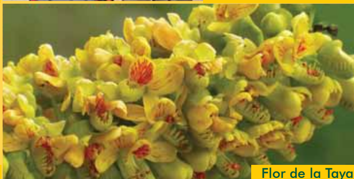
Flor de la Taya

Promueve el trabajo conjunto de las autoridades con los pobladores del campo, la ciudad y las instituciones que trabajan en Cajamarca, para lograr que las siguientes generaciones también disfruten y utilicen la biodiversidad de la región.