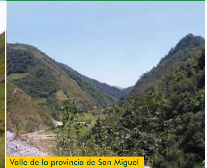
Valle de la provincia de San Miguel