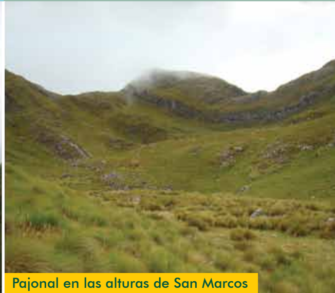
Pajonal en las alturas de San Marcos