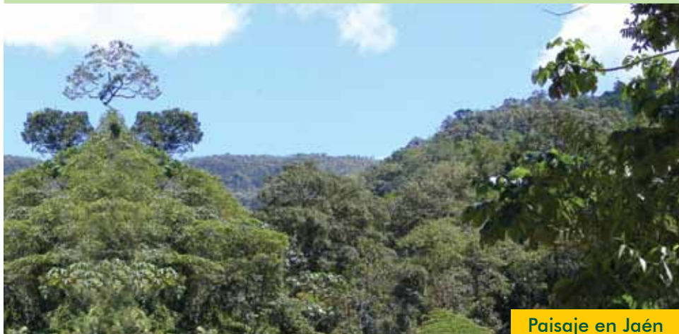
Paisaje en Jaén

Bosques densos y húmedos en zonas de selva, ubicados en las provincias de San Ignacio y Jaén, que concentran abundante neblina.