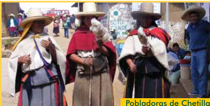
Pobladoras de Chetilla